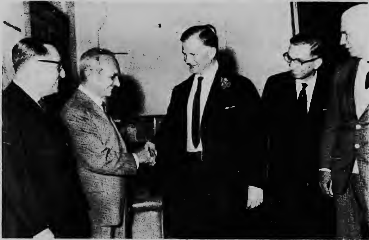
Esaki ta e senadornan, cinco en total, di Partido Democrata qu a vota pa kita autoridad for di presidente. E autoridad aki tabata un decision qusenado a tuma na año 1964 tempu qu tabatin un crisis den Tonkin Gulf. E senado a rechaza nan proposicion cu 92 contra 5 voto.